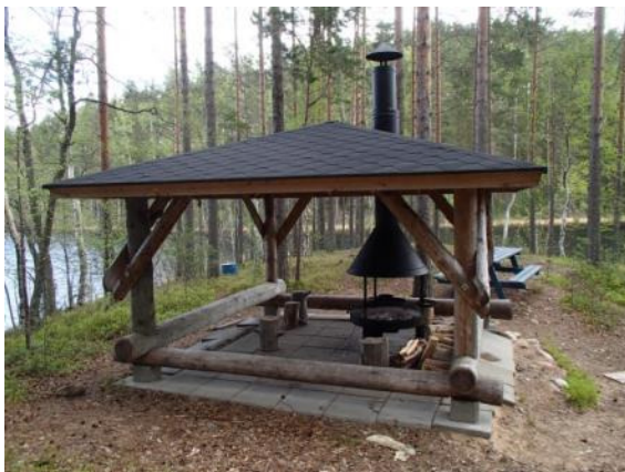
Grillikatos Pullikaisen saaren suojaisassa sisälahdessa.

Kaikki säätiön virkistysalueet on varustettu retkeilijöitä palvelevilla rakenteilla. Satamosaassa on kaksi saunaa, Hietasaassa ja Ruuhonsaassa on myös saunat. Muissa kohteissa on grillikatoksia, laavuja ja nuotiosijoja. Käymälä on välttämätön palvelu, joka onkin jokaisessa kohteessa ja isommilla alueilla useita. Tarassiinlahdella, Pohjanrannalla ja Hiitolanjoella on lintutornit.