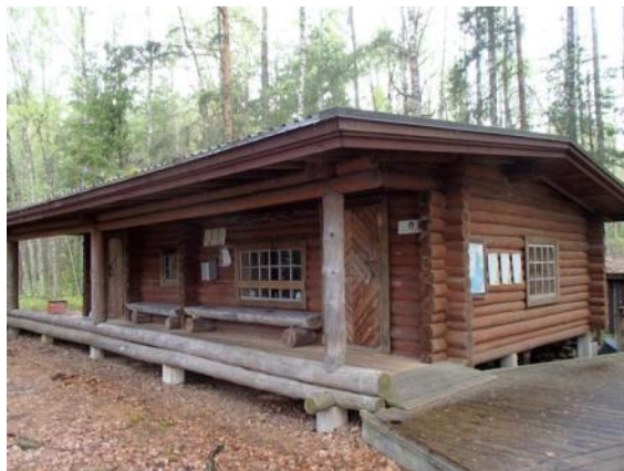
Satamosaassa ns. vanha sauna, joka tuli alueen kaupan mukana. kulumiselta.

Liikuntaesteisille liikkumista helpottavia rakenteita on Satamosaassa, Ilkonsaassa ja Hiitolanjoen Kangaskoskella. Pien-Rautjärven lintutornien alatasanteelle pääsee pyörätuolilla, näissä kohteissa on myös inva-mitoituksen mukaiset tilavat käymälät. Vastaavat käymälät on myös Päihäniemen ja Lepänkannon alueilla, joissa maasto on melko tasaista ja kovapohjaista kangasmaata.