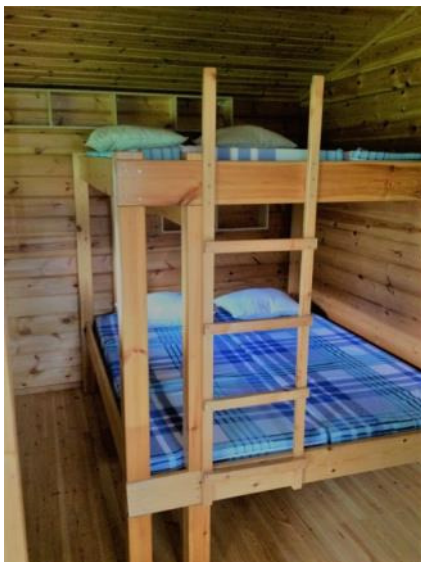
Muukonsaaren leirimökkien sisustusta muutettiin viihtyisämmäksi muutostöillä sängyissä sekä uusimalla patjat ja tyynyt.

Muukonsaaren kehitystyö käynnistettiin kunnostamalla leirimökkien kalustus matkailukäyttöön paremmin soveltuviksi sekä alueen ympäristöä ja rakennuksia kunnostamalla. Nämä toimenpiteet sisältyivät haettuun investointihankkeeseen 'Retkisatamat Geopark-kuntoon'.