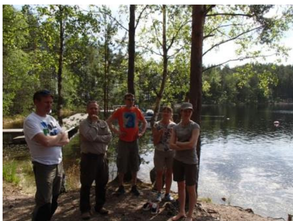
Virkistysalueyhdistysten edustajia tutustumassa Satamosaareen toukokuussa.

Päijänteen virkistysalueyhdistyksen hallitus teki kokous- ja tutustumismatkan Etelä-Karjalaan, käynti Satamosaarella – kovan tuulen takia Ilkonsaarella piti jättää jäi käymättä.