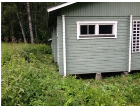
Muukonsaaren saunan perustustolpat ovat kuvassa ennen Joutsenon työpajan kunnostusprojektia.