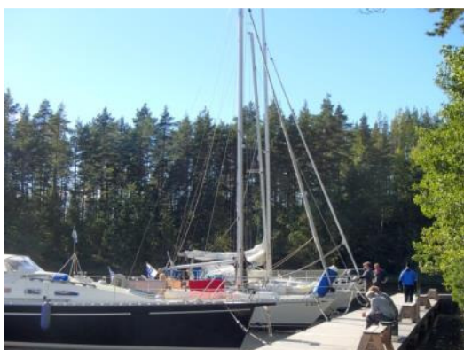
Satamosaaren laiturissa veneitä syyskuussa.

Perinteiset vieraskirjat eivät ole riittävä ja luotettava kävijäseurantaväline, sillä ne eivät säily kaikissa kohteissa, ja merkintöjä tehdään yleensäkin satunnaisesti. Vertailukelpoinen tilasto on PSSry:n huoltoalus Roope-Saimaan miehistön keräämät tiedot retkisatamien jätteistä, myös wc-paperin ja kuorikkeen kulutuksesta voi tehdä päätelmiä kävijämäärien kehityksestä. Säätiön tilastoi PSSry:n toimittamat tiedot.