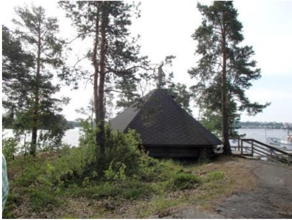
Karhusaaren laavu sijaitsee Kaupunginlahden edustalla. Laavun alue on vuokrattu Lappeenrannan seurakuntayhtymältä.