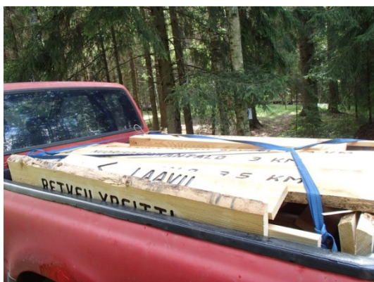
Retkeilyreittiviittoja menossa kunnille maastoon vietäväksi.

Hankkeen toinen osa kohdistui retkeilyinformaation päivittämiseen sekä nettisivuilla, Etelä-Karjalan maakuntaportalissa sekä uudella maakunnallisella retkeilyesitteellä, josta tehtiin kolme eri kieliversiota.