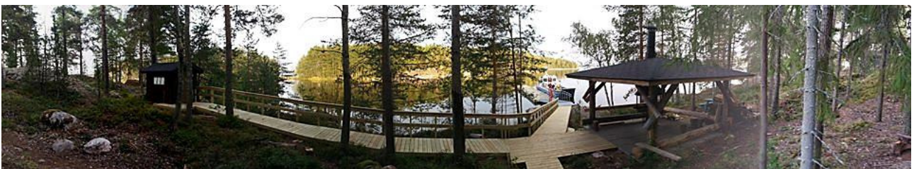
Ilkonsaaren risteilylaiturin uudet rakenteet kulkuväylineen.

Tässä hankkeessa ovat mukana myös kunnat omilla osahankkeillaan. Projektipäällikön tehtävästä vastannut asiamies avusti myös kuntien osahankkeiden toteuttamisessa esim. toteutuksen ratkaisuja pohdittaessa ja hankinnoissa.