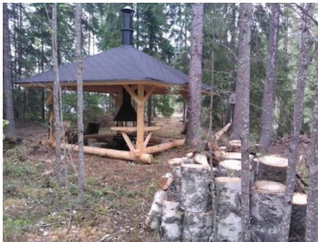
Monnonlahden nuotiokatos. Alueelle tehtiin myös käymälä ja laituri. Pien-Saimaan rannalla sijaitseva kohde palvelee Kuukanniemeläisiä, jotka pääsevät paikalle maitse ja Väliväylän melojia.

Vuonna 2011 aloitettu kuntien kanssa toteutettu investointihanke sai jatkoajan ensin vuodelle 2013 ja edelleen 2014 syyskuun loppuun. Hankkeella rakennettiin hankesuunnitelman mukaisesti retkikohteisiin uusia rakenteita palvelemaan käyttäjiä. Virkistysaluesäätiön osahankkeessa viimeisenä vuonna valmistui Monnonlahden retkikohde ja rantautumispaikka Lemille, Ilkonsaaren risteilylaiturin yhteyteen liikuntaesteisille soveltuva grillikatos ja kulkuväylät sekä toteutettiin uudet kolmekieliset infotaulut Hiitolanjoen virkistysalueille.