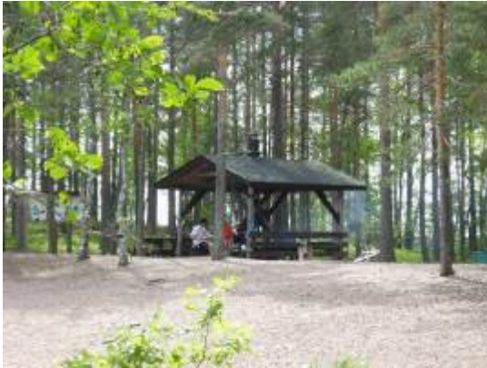
Ilkonsaaren nuotikatos 10.6.07

Virkistysalueiden käyttö on vapaata jokamiehenoikeuksin sekä säätiön jäsenkuntien asukkaille että matkailijoille. Alueilla ei ole kattavaa seurantaa, joten tarkkoja tilastoja käyttäjien määristä on mahdoton saada. Tietoja kävijöistä ja käytön muutoksista saadaan lähinnä vieraskirjoihin tehtyjen merkintöjen perusteella sekä polttopuiden kulutuksesta ja jätemääristä. Kesäkuussa 2005 käyttöön otetusta maksujärjestelmä odotettiin saatavan tilastotietoja käyttäjistä virkistysalueittain. Maksuja tuli edelleen vuonna 2007 niin vähäisesti, ettei niistä voi tehdä päätelmiä kävijämääristä.