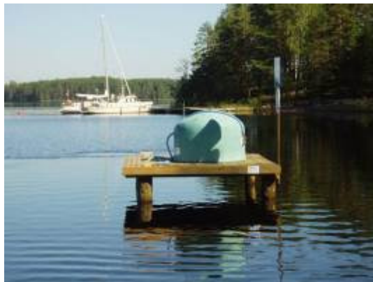
Veneiden septitankin tyhjennys helpottui, kun Ruuhonsaaren saatiin kiinteä tvhiennvssäiliö.

Virkistysaluesäätiön ja kuntien uudennainen yhteistyömuoto on myös retkeilyn infrahanke, jolla kunnostettiin ja täydennettiin retkikohteiden rakenteita ja rakennettiin kokonaan uusia retkikohteita. Virkistysaluesäätiö hallinnoi hankkeen, josta osan rahoittavat ja toteuttavat hankkeessa mukana olevat kunnat. Virkistysaluesäätiö rakensi tällä hankkeella vuonna 2007 mm. Huuhanrannalle laavun, poltto- puukatoksen ja käymälän, Päihäniemeen polttopuukatoksen ja Ruuhonsaaren septityhjennysäiliölle kiinteän laiturintelineen. Lisäksi tehtiin pienempiä käymälöiden ja saunojen kunnostuksia yms. Retkeilyn infrahankkeelle saatiin 50 %:n rahoitus Kaakkois-Suomen ympäristökeskukselta, ja myös tämä hanke päättyi vuoden lopussa.