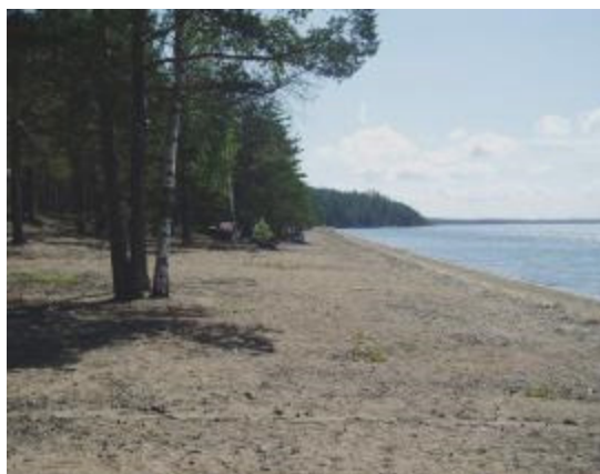
Huuhanranta Ruokolahdella on yksi uusista virkistysalueista

Säätiön alkuaikoina toiminta painottui Saimaalle ja sen lähialueille, mistä säätiö on hankkinut omistukseensa seudullisia virkistysalueita. Saimaan alueella säätiöllä on nyt Huuhanrannan hankinnan jälkeen yhteensä 5 saarikohdetta ja 3 mantereella sijaitsevaa virkistysaluetta. Saimaan vesistön ulkopuoliset säätiön omistamat alueet sijaitsevat Rautjärven Hiitolanjoella (kaksi erillistä aluetta) ja Parikkalassa Pien-Rautjärvellä (kaksi erillistä aluetta).