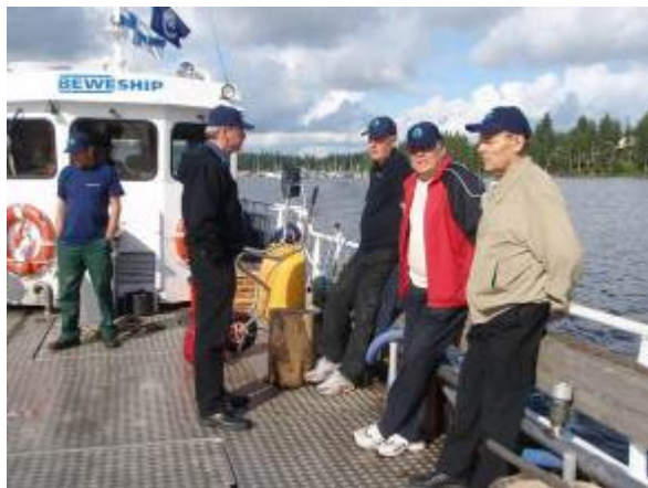
Virkistysaluesäätiön työvaliokunta huoltoalus Roope-Saimaan kannella heinäkuussa.

Alueiden huollosta on tehty sopimukset eri yhteisöjen kanssa, ja näin huoltotoiminta toteutui entisten vuosien tapaan. Tärkein yhteistyökumppani on Pidä Saaristo Siistinä ry , jonka huoltoalus Roope-Saimaa kiertää Saimaan alueen kohteet viikoittain vilkkaimmalla veneilykaudella.