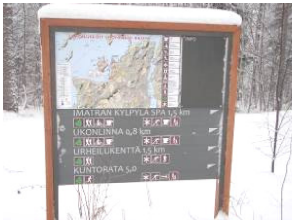
RELA-hankkeessa toteutettu opastaulu Ukonniemen-Rauhan maastoon.

Projektin tavoitteena on Etelä-Karjalan ympärivuotisten virkestys- ja luontomatkailupalvelujen lisääminen ja laadun parantaminen, retkeilypalvelujen tavoitettavuuden parantaminen, sekä maakunnallisen ja valtakunnallisen tiedottamisen ja markkinoinnin tehostaminen luonnon virkestyskäyttömahdollisuuksista Etelä-Karjalassa.