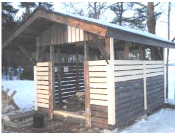
Karhusaaren polttopuukatoks korjausten jälkeen.

Ilkonsaaresta poistettiin loppusyksyllä veneilijöiden rakentama telttasauna, vaikka toimenpiteellä pahoitettiin saunan käyttäjien mieltä. Virkistysaluesäätiö ei voi ottaa vastuuta väliaikaisten rakenteiden muuttamisesta pysyviksi palveluiksi