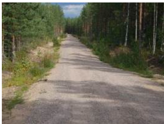
Rastinniementie ja uusi sorapinta.

Virkistysaluesäätiö on osakkaana tiekunnissa Rastinniemiessä ja Päihäniemiessä. Tiehoitokuntia ei ole perustettu Huuhanrannalla, Hiitolanjoella ja Lepänkannossa, joiden tieasioissa on myös oltu yhteydessä muihin tien käyttäjiin. Kaakkois-Suomen metsäkeskus sai valmiiksi Rastinniemen tienparannushankkeen, ja tie sai sorastuksen.