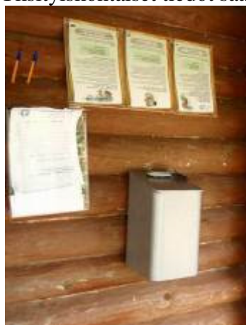
Saunamaksujen keräyslipas, saunavuorojen varauslistat ja ohjeet kolmella kielellä Satamosaaren vanhalla saunalla.

Yksityiskohtaiset tiedot säätiön taloudesta ilmenevät tilinpäätösasiakirjoista.