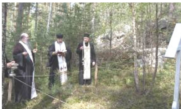
Ilkonsaaren siunaustilaisuus 25.5.2009 oli esillä sekä lehdissä että YLEn alueuutisissa.

Alueen ja maakunnan lehdet kirjoittivat virkistysaluesäätiön toiminnasta useita artikkeleita, samoin Etelä-Karjalan radio ja Kaakkois-Suomen tv-uutiset kertoivat virkistysaluesäätiön toiminnasta muutaman kerran.