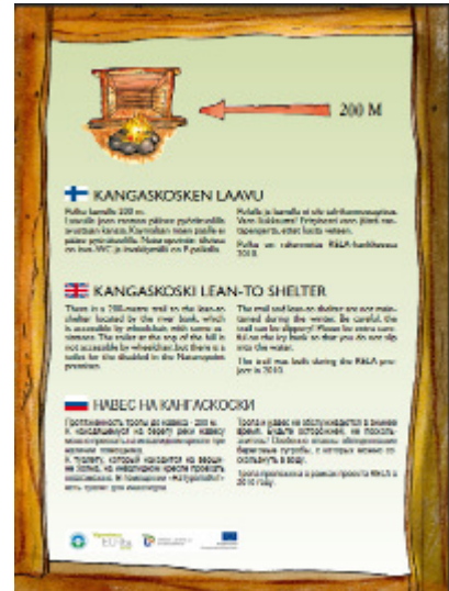
RELA-hankkeessa teetettiin useita opastauluja retkikohteisiin, tässä opastus Kangaskosken laavulle.

Maakuntaportalissa toteutettua retkikohderekisteriä täydennettiin ja kehitettiin yhteistyössä Tietomaakunta eKarjalan kanssa.