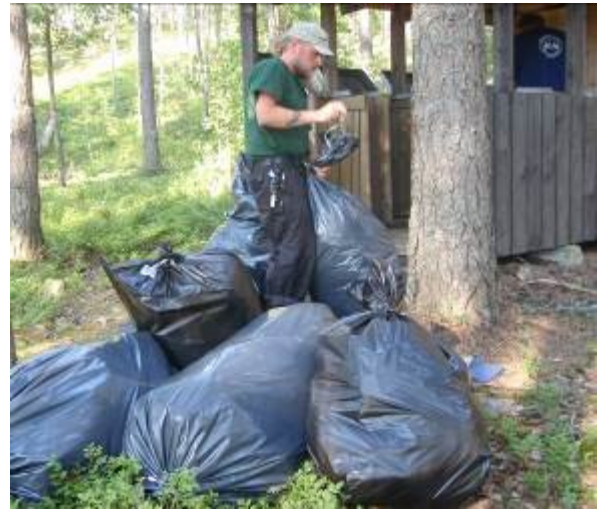
Jätettä kuljetettiin retkisatamien jäteposteistä kesällä 2010 ennätysmäärä.