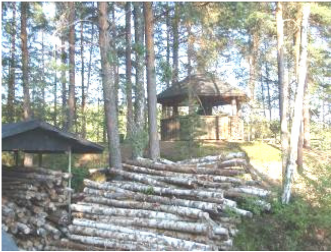
Polttopuuta Satamosaarella katoksessa ja katoksen vieressä.

Polttopuutilanne retkisatamissa oli loppukesällä hyvä, kun sekä StoraEnsolta että UPM-Kymmeneltä saatiin lahjoituksena polttopuurankakuormat, jotka lastattiin Roope-Saimaan kyytiin tehtailta Imatralla ja Lappeenrannassa. Lisäksi Tornatorin hakkuulta Kyläniemestä saatiin 17,5 m 3 energiapuuta, josta säätiö maksoi korjuuyrittäjälle puiden ajosta rantaan.