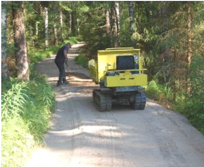
RELA-hankkeessa toteutettu liikuntaesteisille soveltuva kulkuväylä Kangaskosken laavulle.

Hankkeen viimeisenä vuonna saatiin valmiiksi aineistot Etelä-Karjalan vesiretkeilykartastoon ja ’Parhaat retkikohteet Etelä-Karjalassa’ -opaskirjaan sekä useita opastauluja retkeilyreiteille. Kangaskosken laavulle (säätien kohde) ja Päräsniemeen (Luumäen kunnan kohde) teetettiin liikuntaesteisille soveltuvat kulkuväylät. Haikkaanlahden reittiä (Taipalsaarella), Torsanpään luontopolun (Ruokolahdella) ja Rautjärven reittien kunnostamisessa ja opasteiden toteuttamisessa säätiö oli hankkeen kautta mukana. Ukonniemen-Rauhan ulkoilu- ja retkeilyreittien opasteita täydennettiin edellisenä vuonna aloitetun mallin mukaan. Reittiluokituksia tehtiin kaikkiin kuntiin.