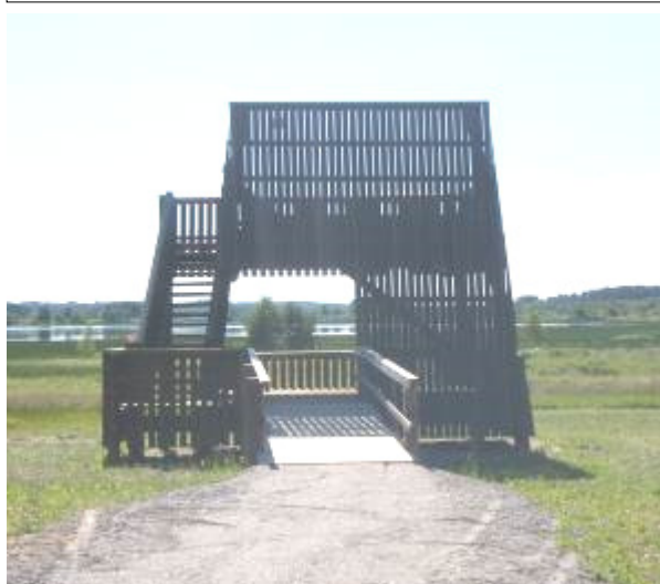
Pohjanrannan lintutorni Pien-Rautjärven pohjoispäässä valmistui keväällä 2010. Tornin alaosa on suunniteltu ja toteutettu liikuntaesteisille soveltuvaksi.