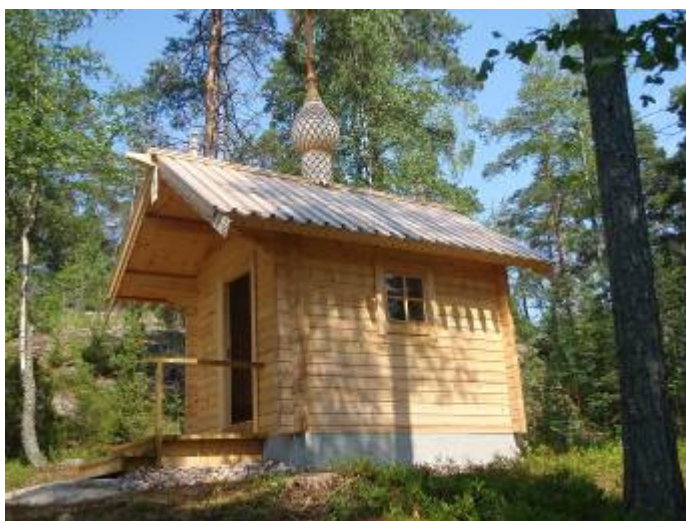
Ilkonsaaren tsasouna avattiin kävijöille heinäkuussa.