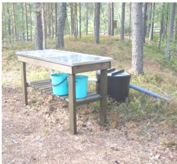
Luontoystävällinen astioidenpesupaikka Satamosaarella oli koekäytössä, ja sai veneilijöiltä myönteisen vastaanoton.

Vuoden 2010 uusia palveluita ovat Kangaskosken laavulle liikuntaesteisille soveltuva polku (RELA-hankkeella), PSSry:n toimesta kotagrillien pohjia uusittiin ja Hietasaaren saunan kiuas vaihdettiin. PSSry rakensi Satamosaaren prototyypin vesistöystävällisestä astioiden pesupaikasta, jossa pesuvesi imeytetään suodatinsäiliön kautta maahan. Pohjanrannalle rakennettiin lintutorni ja käymälä Parikkalan kunnan hankkeessa.