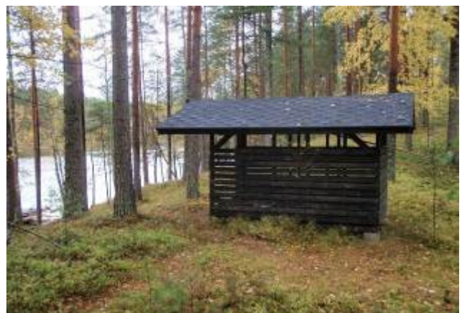
Pullikaisen polttopuukatos valmiina.